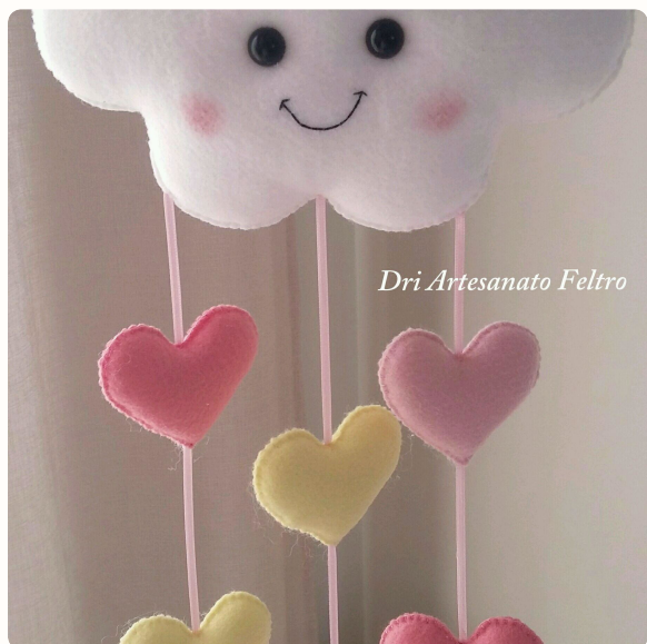
Artesanato em Feltro

Fabricar velas pode ser fácil e lucrativo, e é uma ótima opção para trabalhar em casa.